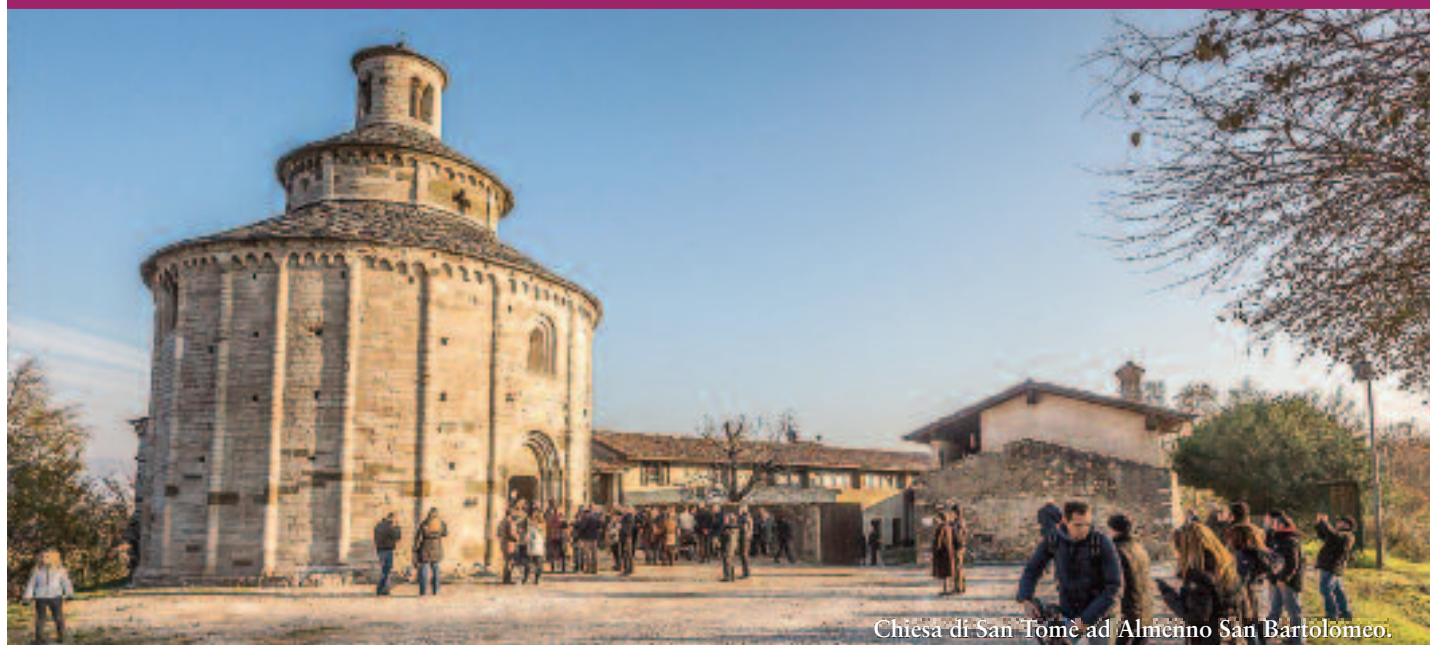
Chiesa di San Tomè ad Almenno San Bartolomeo.

L'ECO DI BERGAMO. IL CUORE BERGAMASCO SCRIVE PER AMORE.